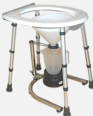
TABORET MIKCYJNY SKŁADANY typ W-TMS