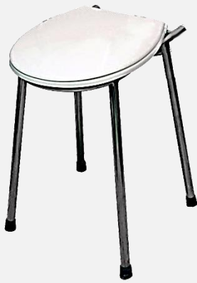
TABORET MIKCYJNY WZMOCNIONY , stal nierdz. typ W-TMW