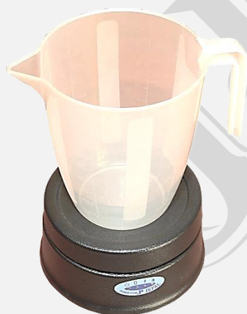
PRZETWORNIK POMIAROWY Z NACZYNIEM 1 LITR (w ofercie również 2 litry)

(*) bez statywu i lejka – mniejsza cena aparatu