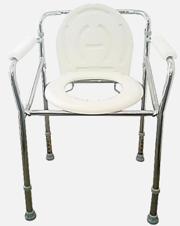
KRZESŁO MIKCYJNE SKŁADANE typ W-KMOS