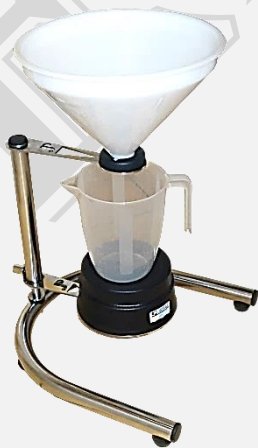
STATYW MIKCYJNY typ W-SMW Z PRZETWORNIKIEM POM.