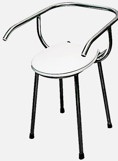
KRZESŁO MIKCYJNE WZMOCNIONE , st. nierdz. typ W-KMOW